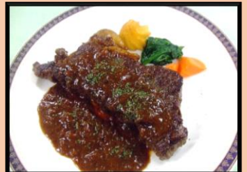
⑦ 牛肉のステーキ 赤ワインソース

※ アレルギー物質につきましてご心配をお持ちのお客様は係員にお申し付けください。 ※ お米の産地は特別な記載をしていない場合、メニューで使用しているお米はすべて国産米です。 ※ 料理法の変更をせずに原材料の産地や品種を変更する場合は、あらかじめ係員よりご案内いたします。 なお、ご不明な点はお申し出ください。