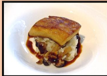
⑥ フォワグラのソテー きのこのリゾット マデル酒のソース