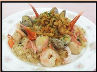
② シーフードピラフ